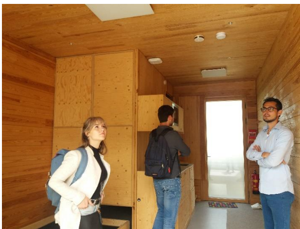
Bezoek aan een woning van Woodys Housing

Er is dit jaar veel energie gestoken in het opbouwen van een band met andere studentenbesturen en studentenhuisvester DUWO. Ook heeft het bestuur veel contact gehad met de contactpersoon bij Woodys Housing vanwege de samenwerking omtrent de plannen voor Juniusstraat 6.