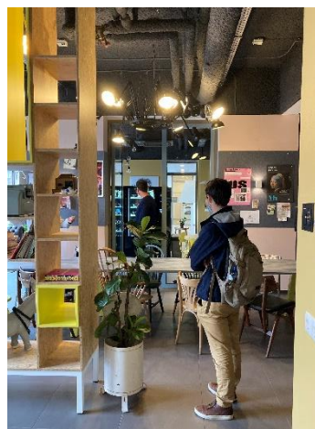
Afspraak met DUWO