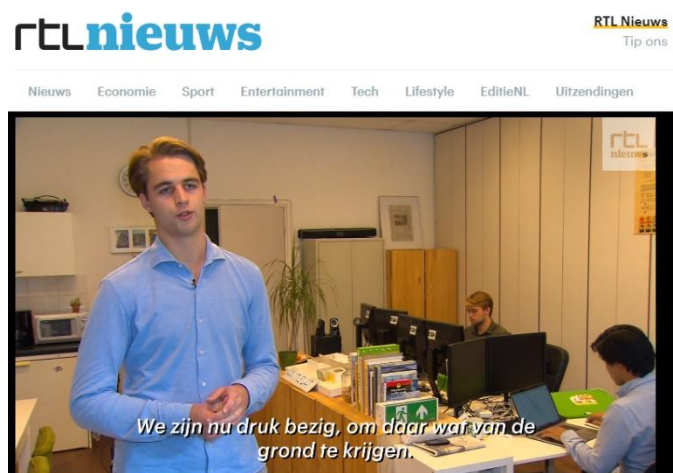
SHS Delft op het RTL Nieuws