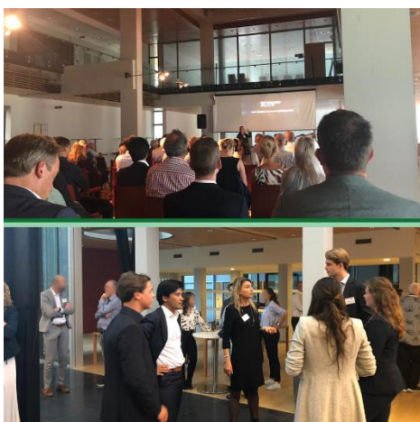
Bezoek aan de BBR

Er is dit jaar veel energie gestoken in het opbouwen van een band met andere studentenbesturen zoals Stylos. Ook heeft SHS haar netwerk in Rijswijk erg uitgebreid. Door ook aan te sluiten bij de BBR (Belangenvereniging Bedrijven Rijswijk). Hier wordt er gesproken met veel directe contacten rondom het nieuwe project.